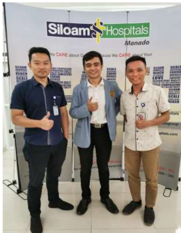
Lampiran 2 Foto bersama Staff ICT Department