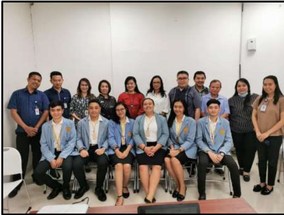
Lampiran 1 Foto bersama pegawai PT.SILOAM INTERNATIONAL HOSPITALS MANADO dan Dosen dosen FMIPA UNSRAT