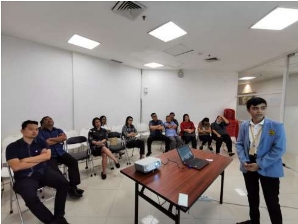
Lampiran 5 Presentasi Akhir di PT.SILOAM INTERNATIONAL HOSPITALS MANADO