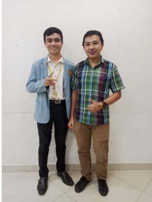
Lampiran 3 Foto bersama Dosen pembimbing PKL